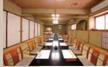
2階宴会場 (26名様まで)