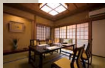
和室椅子席 (20名様まで)