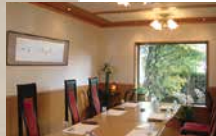
洋室椅子席 (8名様まで)

昼食 / 11:30 ~ 15:00 (食事開始 13:30 最終) 夕食 / 17:30 ~ 22:00 (食事開始 19:30 最終)